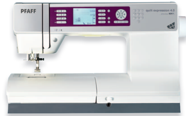
Großzügig. Hell und klar. Präzise.

Entdecken Sie die Vielfalt beim Quilten.